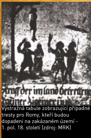
Výstražná tabule zobrazující případné tresty pro Romy, kteří budou dopadeni na zakázaném území - 1. pol. 18. století

To všechno vedlo postupně k systematickému vyčleňování Romů z obcí, měst a států Evropy.