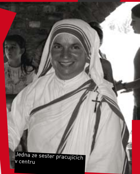
Jedna ze sester pracujících v centru

Náš den se skládal ze dvou částí – ráno jsme před sídlem charity nasedli do přistaveného autobusu a vyrazili za Tiranu do rozestavěného skautského centra, které obklopovala veliká zahrada. Po cestě jsme udělali několik zastávek, na kterých přistupovaly další a další děti, zpívaly se písničky, říkaly říkanky a k centru už autobus přijížděl narvaný k prasknutí. S dětmi jsme potom během dopoledne hráli scénky. Ze starých látek a zbytků oděvů, které se v centru daly najít, jsme si dokázali vyrobit i velmi zajímavé kostýmy. A scénky pak stály za to. Dále se děti mohly za naší asistence věnovat tanci, sportovním či stolním hrám, skládání puzzle, modelování, navlékání korálků apod. Některé ze sester mluvily anglicky a zprostředkovaly tak komunikaci mezi námi a dětmi, protože děti anglicky nemluvily. Před polednem program skončil. Následovalo drobné občerstvení a rozvoz zpět v opačném směru.