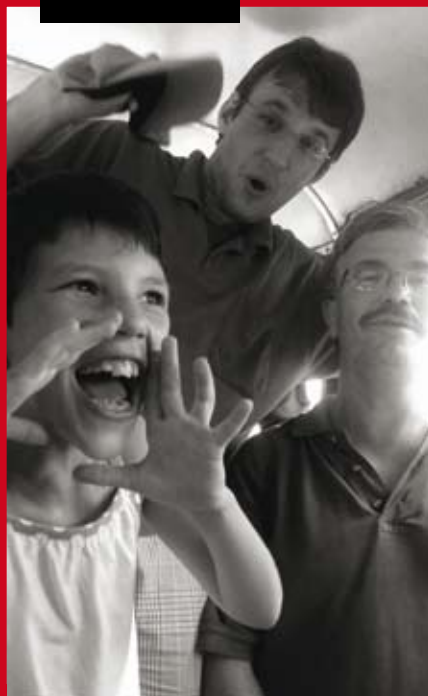
Autobus plný dětí