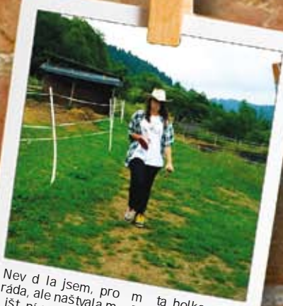
Nevěděla jsem, proč má ta holka nemotivovaně ráda, ale našel jsem ji. Popadla jsem svoji šanci a odešla.