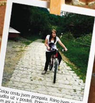
Celou cestu jsem prospala. Ráno jsem se probudila už v posteli. Pomyslela jsem si, že mám tam asi někdo odnesl. Když jsem se dozvěděla, že jsem na raně, napadlo mě, že to tady třeba nebude tak hrozné. Vydala jsem se proto na obhlídku. To jsem ale ještě netušila, co mě čeká.